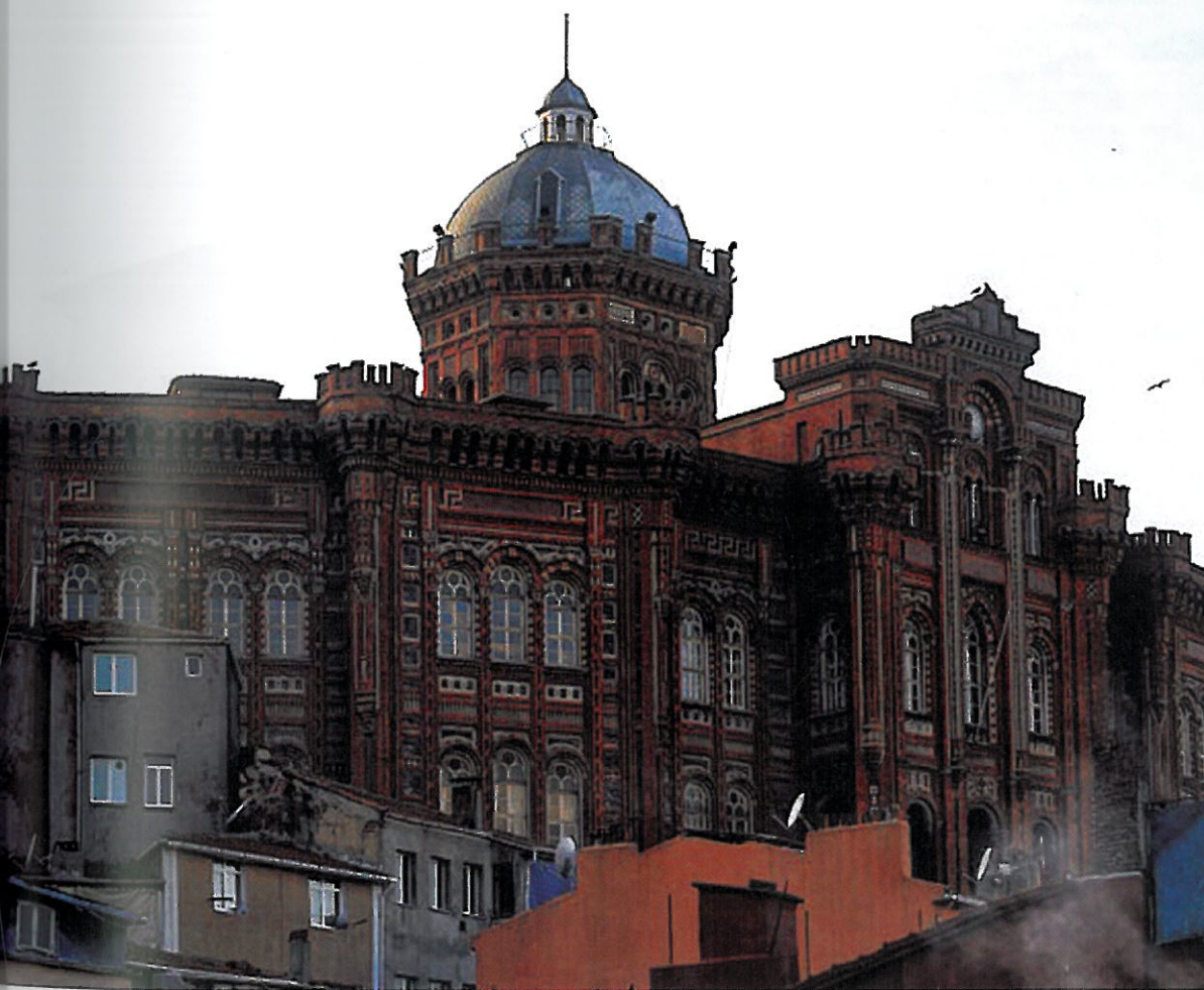
Η Μεγάλη του Γένους Σχολή Great School of the Nation