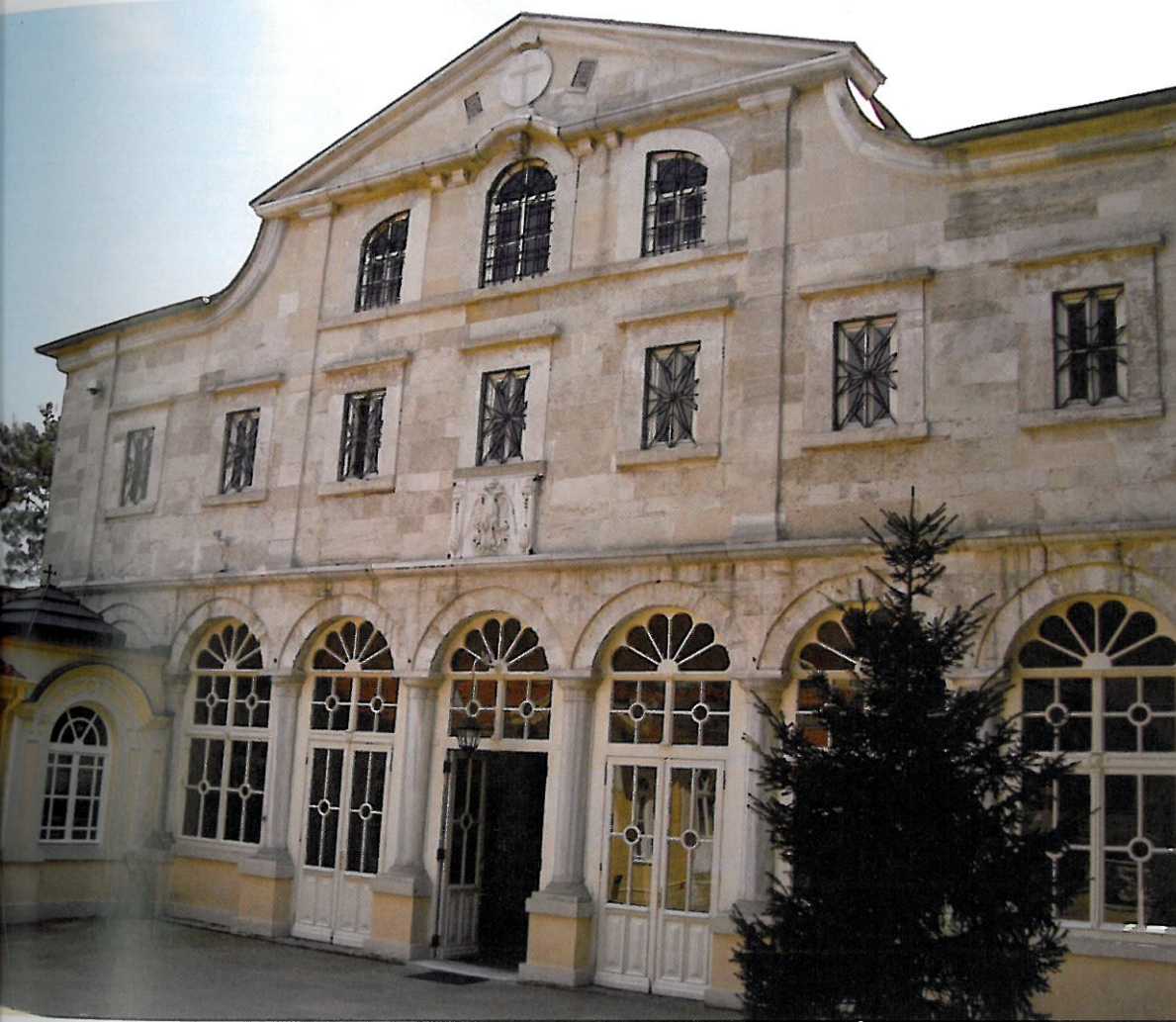
Πατριαρχικός Ναός Αγίου Γεωργίου στο Φανάρι The Patriarchal Church of St. George